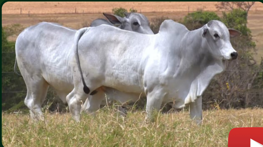
IMAGEM TE DA C.BOI